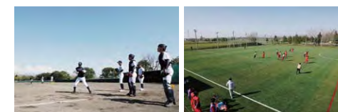
野球練習場 サッカー練習場

体育系・文化系合わせて36のクラブがあり、たくさんの生徒が勉強との両立に努めながら練習に励んでいます。全国や世界で活躍する仲間もいます。